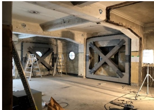
<鉄骨ブレスの設置工事の様子>

さて、リノベーション工事の進捗状況ですが現在は建物補強工事や外壁塗装が終了し、これから内装工事を行います。今後は物販店舗を誘致し、新たにお客様をお迎えする場として生まれ変わる予定です。どのように生まれ変わるのか、皆さんも楽しみにお待ちくださいね。